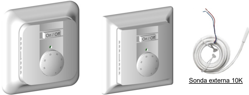
Sonda externa 10K